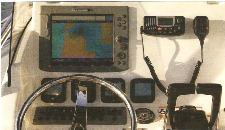
◀ Een treffend voorbeeld van een stuurconsole die is voorzien van alle noodzakelijke elementen voor het avontuur: gps/plotter en marifoon.