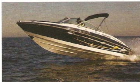
◀ De enige 'vreemde eend in de bijt' tussen de consoleboten en RIBs.